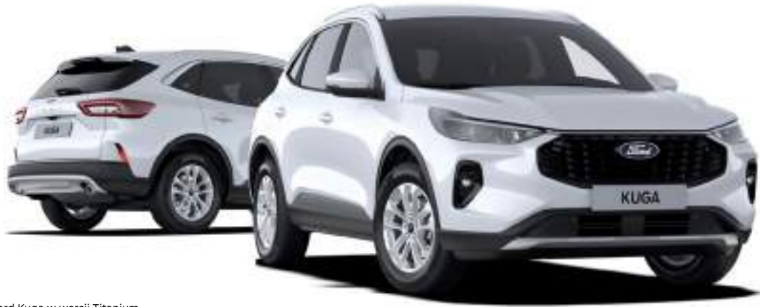
Nowy Ford Kuga w wersji Titanium Kolor nadwozia Frozen White (opcja)