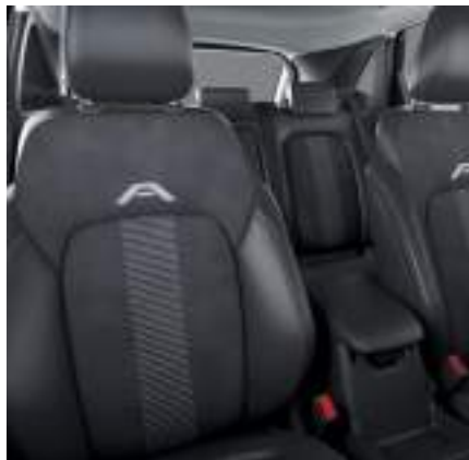
Nowy Ford Kuga w wersji Active X z tapicerką częściowo skórzaną w stylizacji active z przeszyciami w kolorze szarym (standard)