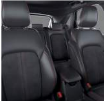
NOWY ford KUGA W WERSJI ST-LINE X z tapicerką częściowo skórzaną z przeszyciami w kolorze czerwonym (standard)