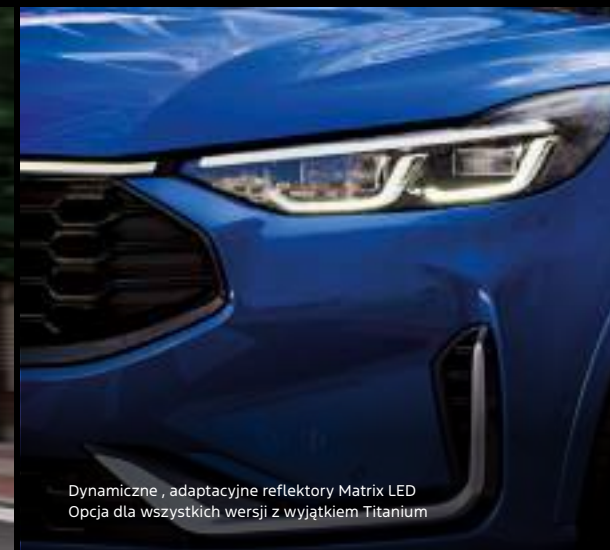
Dynamiczne, adaptacyjne reflektory Matrix LED Opcja dla wszystkich wersji z wyjątkiem Titanium

Nowy Ford Kuga w wersji ST-Line X z opcjonalnym wyposażeniem Kolor nadwozia: Desert Island Blue (opcja)